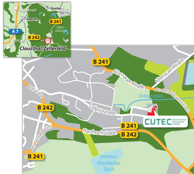
Karten: openstreetmap.de (geändert)

Das Netzwerk Ressourceneffizienz wird von der VDI Zentrum Ressourceneffizienz GmbH koordiniert. Das Netzwerk Ressourceneffizienz wird aus Mitteln der Nationalen Klimaschutzinitiative des Bundesministeriums für Umwelt, Naturschutz, Bau und Reaktorsicherheit finanziert.